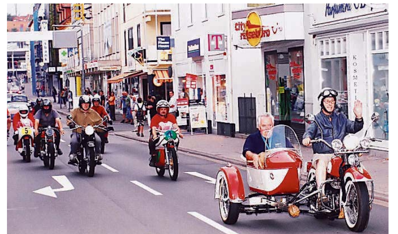
Ehrenrunde 2009 mit alten Maschinen durch die Bahnhofstraße.

Café Espert gegründet. Noch im gleichen Jahr lief die erste Motorradsportveranstaltung im Saarland nach dem Zweiten Weltkrieg, ein Geschicklichkeitsturnier mit Fuchsjagden. 1949 und 1950 folgten der